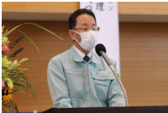
主催者代表挨拶（増田社長）