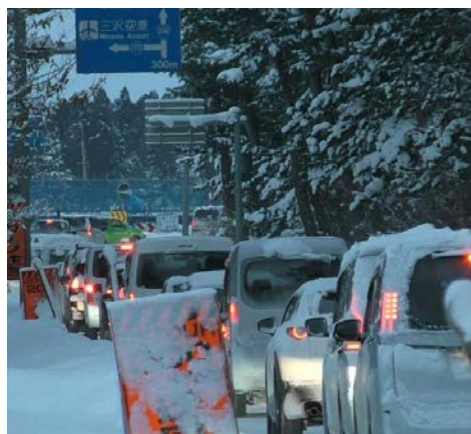
高瀬川第二橋合流地点の渋滞