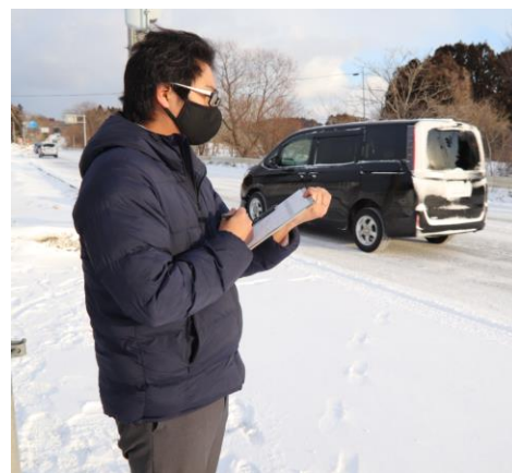
通行車両台数の確認作業