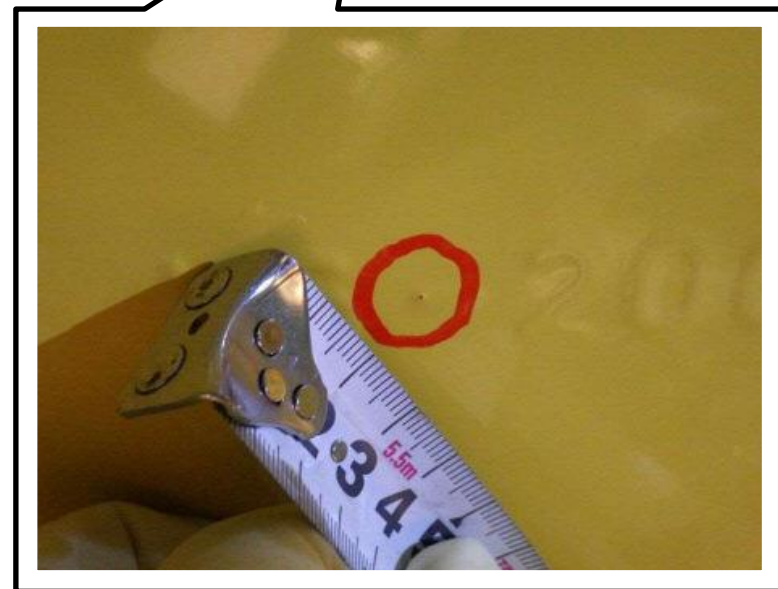
廃棄体底部に膨らみを確認