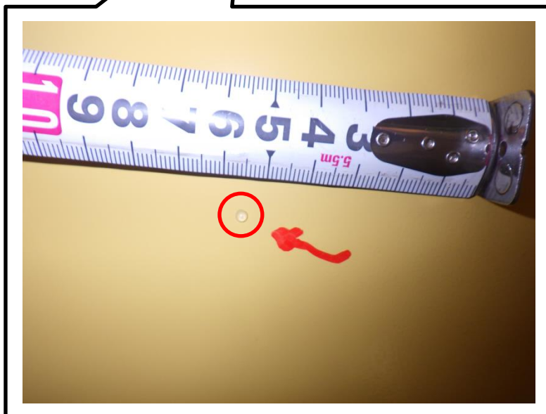
廃棄体底部に水滴を確認