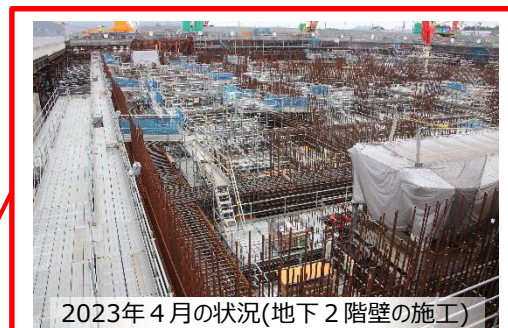
2023年4月の状況(地下2階壁の施工)