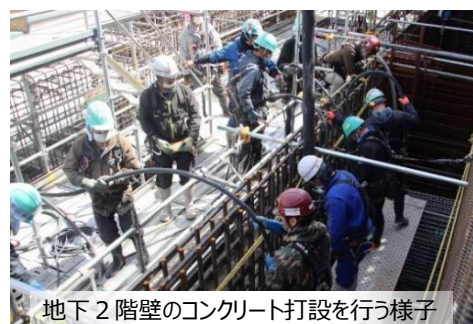
地下2階壁のコンクリート打設を行う様子