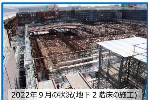
2022年9月の状況(地下2階床の施工)