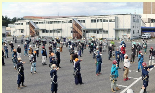
朝礼で安全確認を行う協力会社の方々