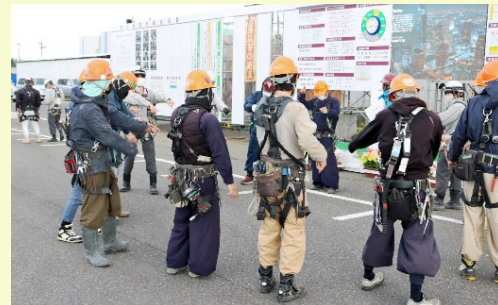
作業前の危険予知ミーティングの様子

当社は、地域の皆さまのご理解とご協力の下で事業を進められており、引き続き、設工認対応と工事を着実に進め、1日も早いしゅん工に向けて、当社と協力会社が一丸となって安全を最優先に工事に全力で取り組んでまいります。