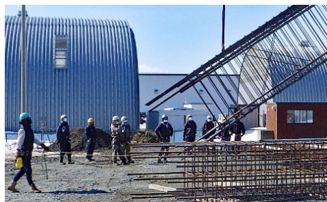
鉄筋の組立て方や搬入・据付の段取りを事前に確認する様子

機器についても同様に、メーカの工場ブロック単位に組立てを行うことで、現場での作業を減らし、大型クレーンで設置していきます。