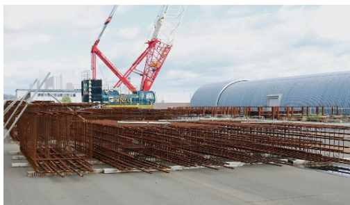
作業しやすい広い場所で鉄筋を組み立てた様子