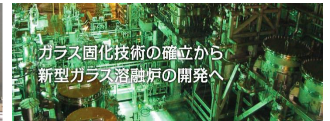
ガラス固化技術の確立から 新型ガラス溶融炉の開発へ