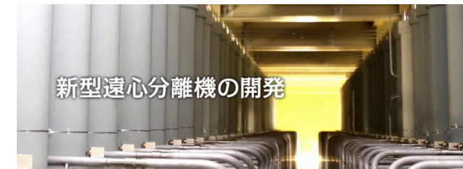
新型遠心分離機の開発