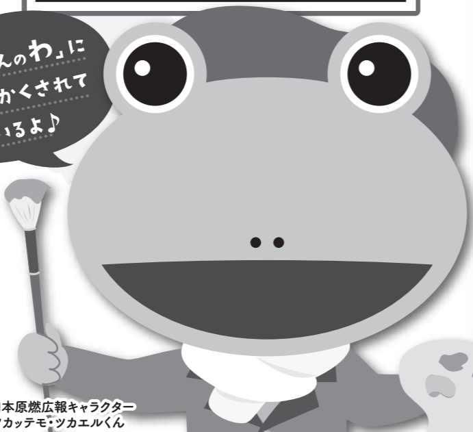
日本原燃広報キャラクター ツカテモ・ツカエルくん