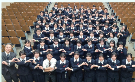
青森県立弘前中央高等学校 吹奏楽部