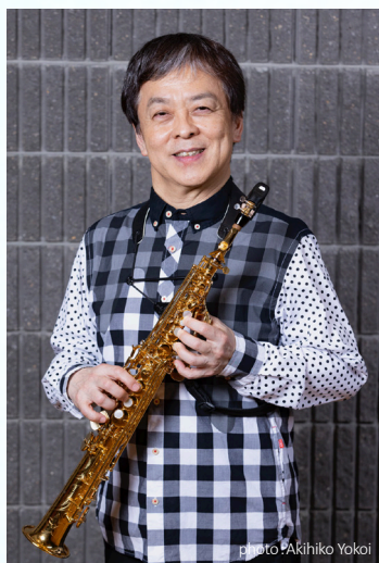
須川展也(ソプラノ・サクソフォン)