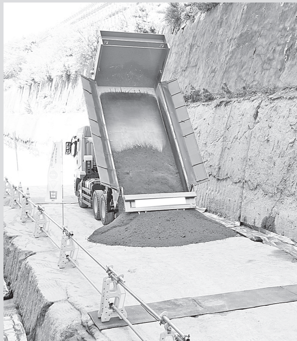
覆土を開始する様子

これからも地域の皆さまのご理解と地元企業の方々のご協力をいただきながら、安全を最優先に工事を進めてまいります。