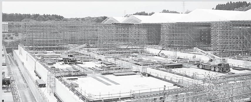
地上部から見た1号廃棄物埋設施設