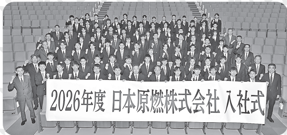
新入社員と当社役員の集合写真

4月1日(水)、六ヶ所村文化交流プラザ スワニーで入社式を開催し、新入社員89名(うち県内出身者70名)を新たな仲間として迎え入れました。