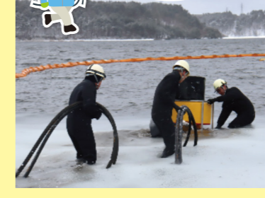
厳冬期における 取水訓練

工場の安全性を保つためには冷却機能の維持が必要です。冷やすための水を確保する訓練を、沼の水が凍ってしまうような寒い冬の期間でも欠かさず行っています。