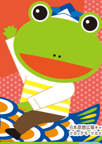
日本原燃広報キャラクター ツカッテモツカエルくん