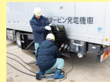
電源車による 電力供給訓練

日本原燃ではさまざまな災害を想定した訓練を積み重ね、万が一の際に迅速かつ適切な対応ができるよう備えています。今回は一年を通して行っている訓練の中から一部をご紹介します。