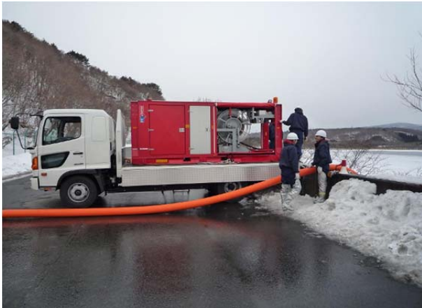
尾駁沼からの冷却水供給訓練