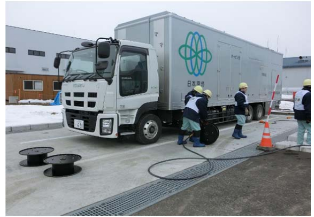
電源喪失を想定した電源供給訓練