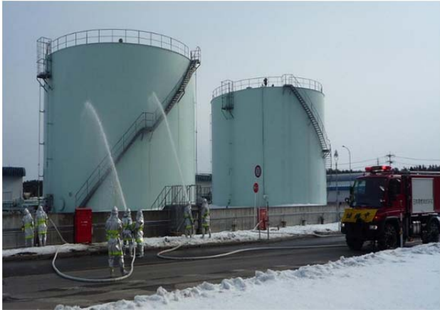
重油タンク火災を想定した消火訓練