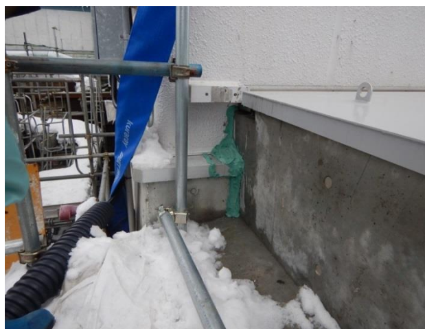
浸入箇所 (シーリング後 (緑色))