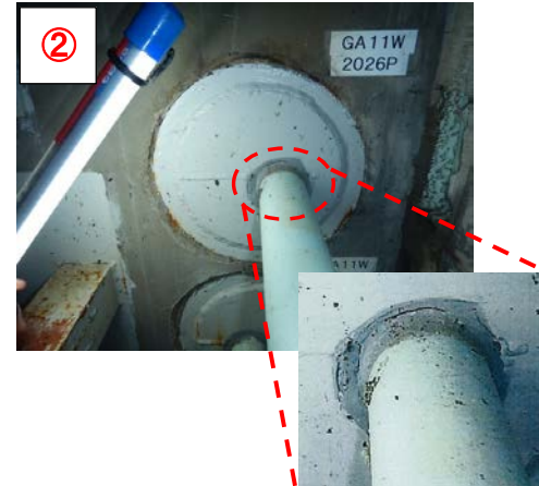
②配管ピット側から確認した配管貫通部