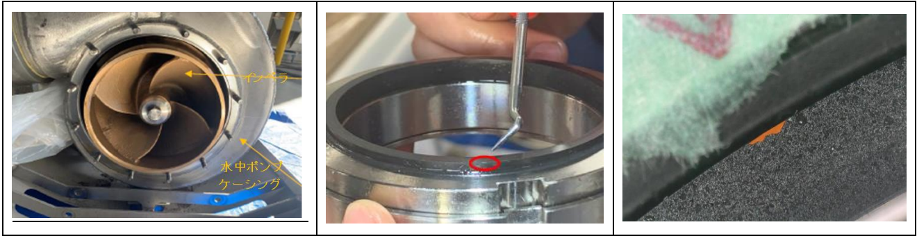
図1 (水中ポンプの空運転によるメカニカルシール損傷箇所からの漏えい)