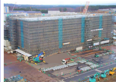
MOX燃料工場の建設現場(12月)