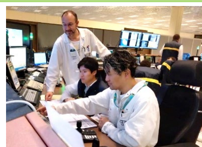
ラ・アークでの運転員訓練(11月)