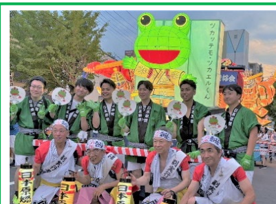
「ツカッテモ・ツカエルくん」前ねぶた(8月)