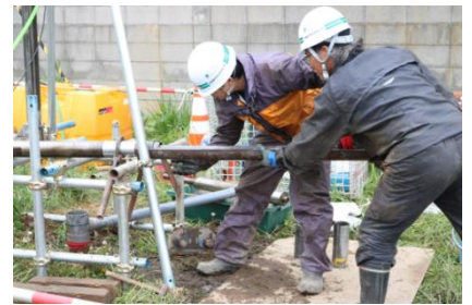
ボーリングコアを採取している様子