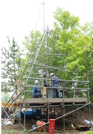
ボーリングの様子