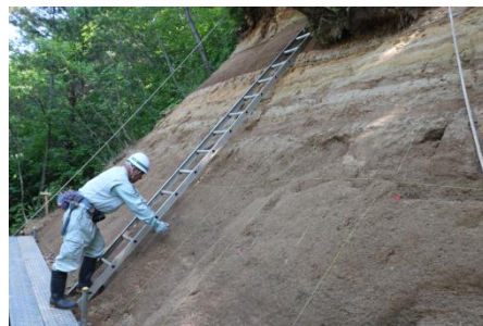
地表地質調査の様子