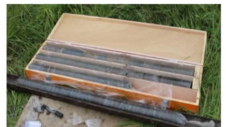
採取したボーリングコア