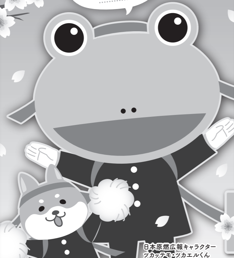
日本原燃広報キャラクター ツカッテモツカエルくん