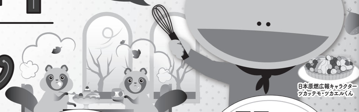
日本原燃広報キャラクター ツカテモ・ツカエルくん