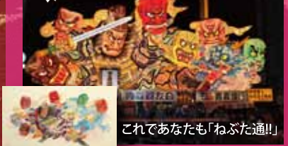
これであなとも「ねぶた通!!」